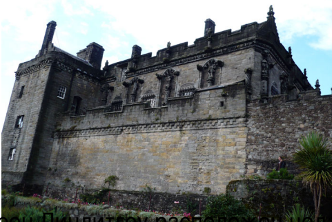
Дворец Ливингстон расположен недалеко от Эдинбурга. Он связан с трагической историей гибели