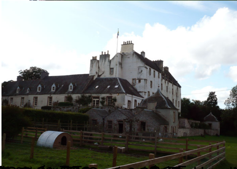
Замок Дунферmlin, Шотландия