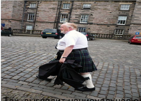
Так выглядит национальная одежда шотландцев и в ней прогуливается доброе количество муж