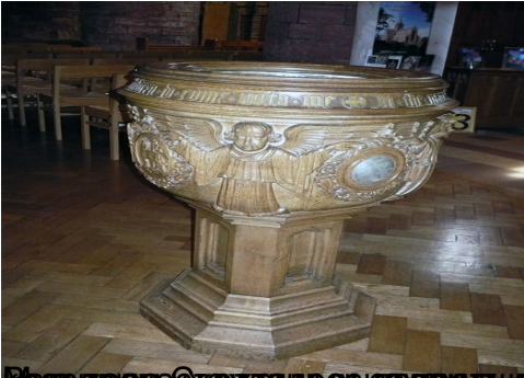
Великий камень, который использовался для крещения в аббатстве Дунферmlin, Шотландия