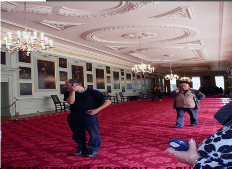
Холирудский дворец — одна из резиденций королей Шотландии и Великобритании. В 1128 году