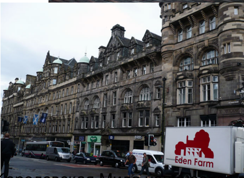
Королевская Миля начинается с Эдинбургского замка.